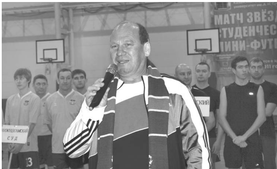
Ильгиз Гилязов, Председатель Верховного Суда РТ:

Самое ценное в судебной системе республики – это люди, в ней работающие. От степени сплоченности коллектива, его способности общими усилиями эффективно решать поставленные задачи зависит абсолютно все в нашей тяжелой и ответственной работе.