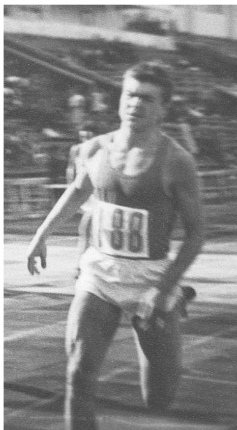
Чемпионат СССР, бег на 100 м. 1985.

Думаю, что чем больше у нас будет спортивных секций, тем выше шансы вырастить новых олимпийских чемпионов. Все возможности