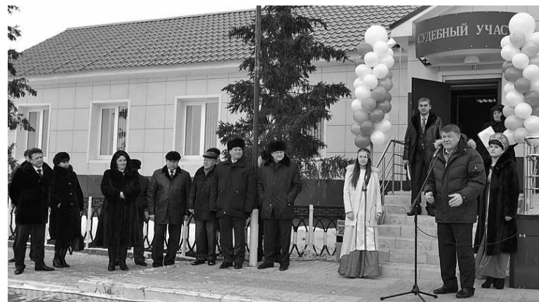
На открытии здания судебного участка